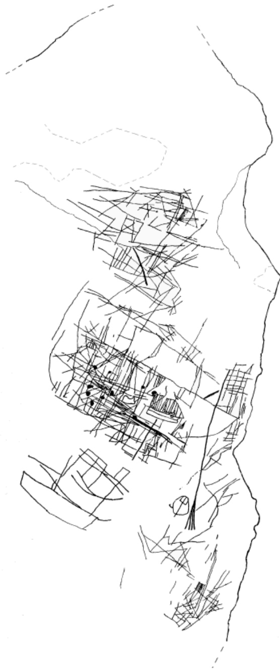
Bco. De Tapia Panel 1 Fig. 1

El panel contiene cinco barcos que hemos descrito, siempre que fue posible, según el orden de ejecución para lo que nos hemos basado fundamentalmente en las diferentes superposiciones (fig. 2). Los motivos se disponen en la zona central e inferior del panel, preferentemente en la primera allí donde se da la mayor profusión de grabados aborígenes, lo que aumenta la dificultad a la hora de individualizar las diferentes embarcaciones e identificar las partes de éstas. A ello habría que añadir que muchas veces los barcos se abandonan, dejándolos inconclusos. El ejemplo más significativo es el número 5, del que sólo se representa el casco. Dada la complejidad mencionada se optó por señalar sólo aquellas partes que están claramente vinculadas a las embarcaciones.