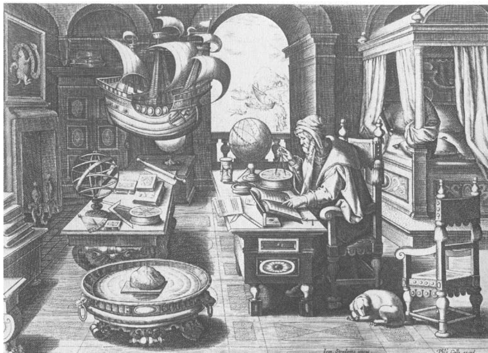
Philips Galle, El sabio renacentista en su estudio