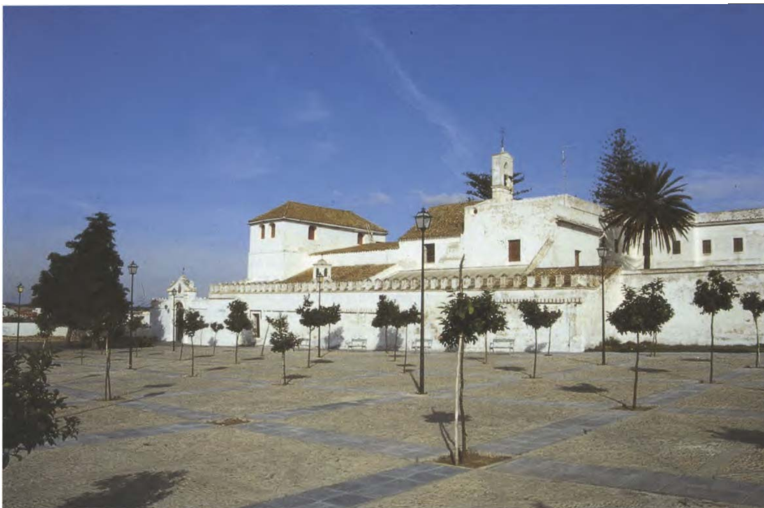
Convento de P.P. Capuchinos. S. XVII. Sede del Colegio de Misioneros. Sanlúcar de Barrameda