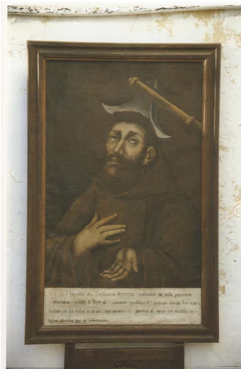
Retrato de misionero capuchino martirizado en Caracas por los indígenas en 1666

Padua nuestro patron en Habito Capuchino como está en su Convto de Capnos. de esta Ciud. y sera la misma Ymagen pidiendola al Supor cuya es, en el interim que la Hermd hiziere otra. Asi mismo ira delante del Sto la zera de la Hermd y demas Insignias Y en las prozesiones particulares si fuesen convidados podran salir si quisieren.