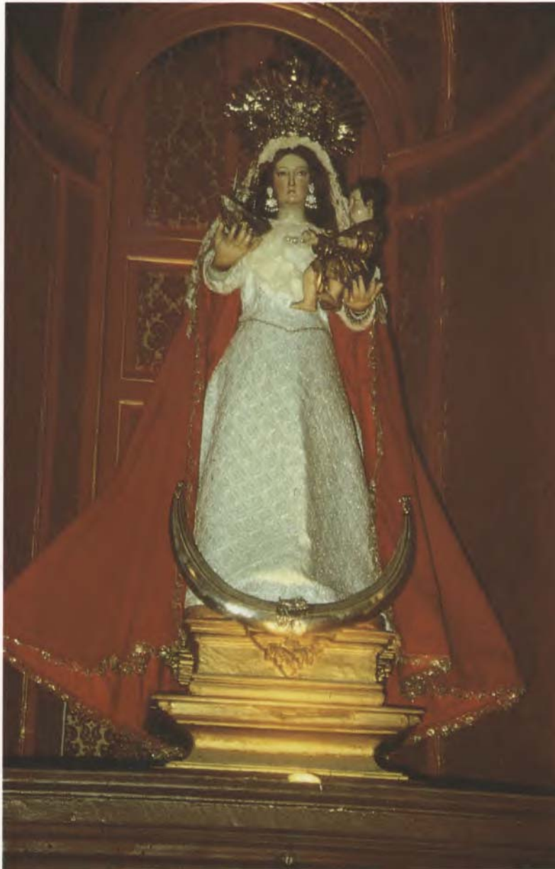
Imagen de Ntra. Sra. del Buen Viaje, protectora de los navegantes a Indias. Convento de Capuchinos. Sanlúcar de Barrameda