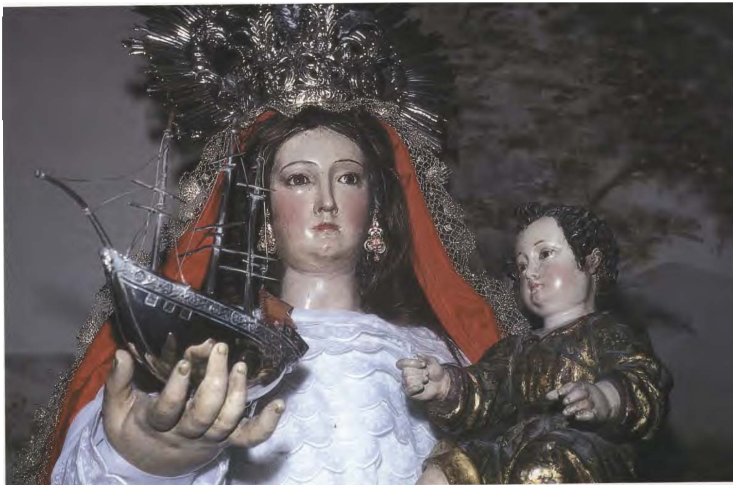
Detalle de Ntra. Sra. del Buen Viaje. Convento de Capuchinos. Sanlúcar de Barrameda