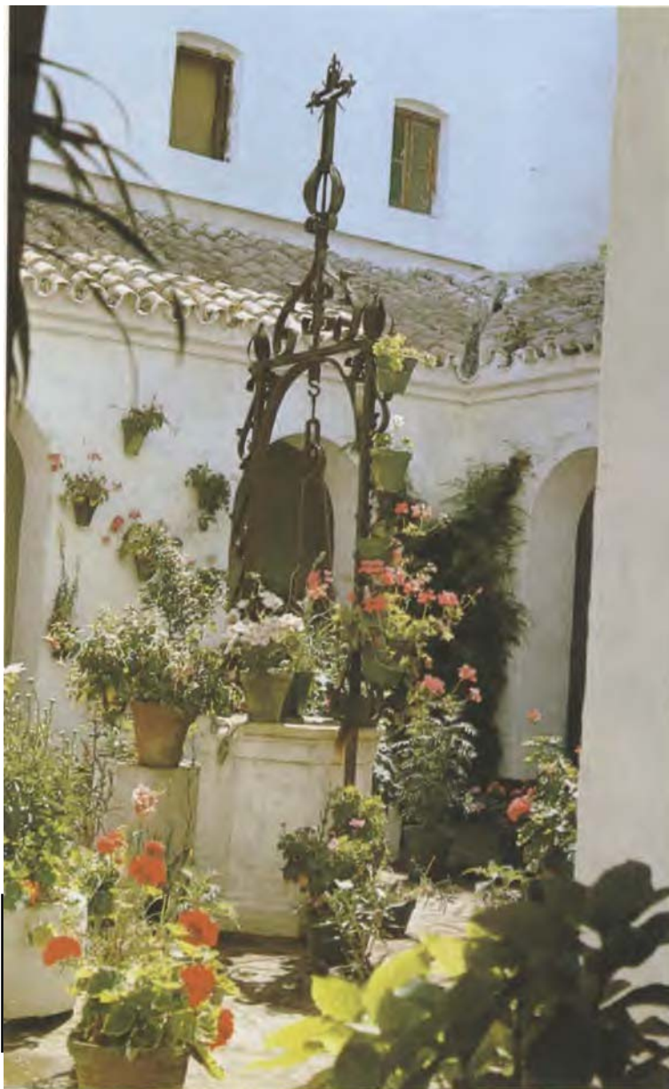
Claustro del Convento de P.P. Capuchinos. Sanlúcar de Barrameda

Esta serie de milagros debieron hacer que el culto a la Virgen se extendiera entre los marineros de la zona, sobre todo en los que emprendían las largas travesías transocéanicas, y así el 5 de Mayo de 1676 se constituye la Hermandad y Cofradía de Nuestra Señora del Buen Viaje y San Antonio de Padua, estableciendo como fiesta la del día 2 de Julio, en la cual salía la imagen en procesión por las calles de la ciudad. Aparece en un documento la relación de hermanos, citando que son hombres de mar y patronos de embarcaciones , personas de escaso nivel cultural como se desprende del hecho de la declaración que hacen de no saber firmar; no son miembros de la oligarquía local, ninguno tiene tratamiento de don , sino que pertenecen al grupo de los no privilegiados . La Hermandad se nutre de las pequeñas limosnas que aportan los hermanos y donaciones, como por ejemplo las que el 23 de Diciembre de 1683 hizo Luis de Ortega y Calderón, residente en el Convento, de una caja de madera de cedro para guardar los vestidos de la Virgen y un Santo Cristo de marfil con la Cruz de ébano e incrustaciones de plata y una corona de filigrana para colocar como remate y trono de Nuestra Señora del Buen Viaje, los cuales aún hoy se conservan en el Convento de Capuchinos.