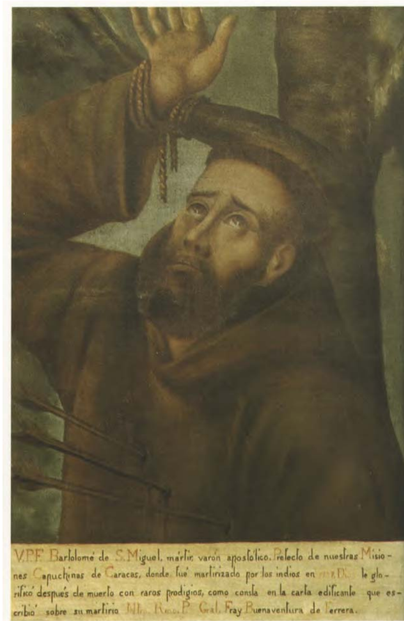
V.P.F. Bartolomé de San Miguel, Prefecto de las Misiones Capuchinas de Caracas, martirizado en 1737

más que suficientemente estar en posesión la referida hermandad, antes que el dicho convento, de el sitio, que no ocupó éste hasta el año de 1634, y por el convenio de la existencia en el mencionado convento, y también de hazer sus fiestas (y demás actos) en todos tiempos con la magnificencia que ellos, y más facultades han permitido. A lo que, sin disminuir el precedente fundamento, se debe agregar, que aún atendido el fin que se dize proponerse de presente dicho. Convento no parece tiene oposición alguna con la referida ntra. Hermandad; pues fuera de que es una sola su función en todo el año, y ésta por lo deteriorado de las limosnas, ha llegado a términos de contentarnos con hazerla quitados los bullicios que en otras ocasiones por ellas se movían; los R. R.P. P. no concurren a ella más que a lo espiritual de misa y sermón.