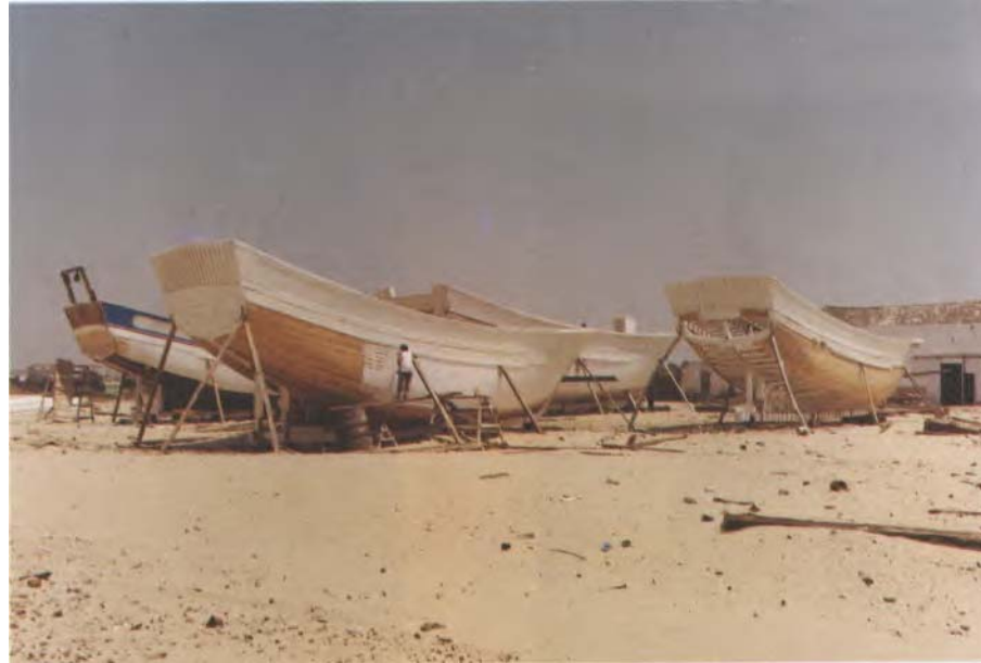
Carpintería de ribera. Bajo de Guía

San Antonio sita en el Convento de M. R. R. P.P. Capuchinos de esta Ciudad de Sanlúcar de Barrameda y en nombre de ella ante V. E./ Rma. con el mayor respeto dize: ha llegado a sus noticias qe. mediante el nuevo método y Régimen ordenado para este dicho Convento por V. E./ Rma. al alguna dificultad en que pueda subsistir la referida nuestra hermandad, haciendo su annual función a la mencionada Sra. nuestra titular, y de el mismo convento, por mía razón y por mandato de V. E./ Rma. se nos han entregado por los enunciados R. R.P. P. todas las alhajas propias de la dicha Hermandad, e Imagen con excepción de las precisas para sus diarias decencias qe. todas constan de la lista, qe. con estas suppcas. acompañamos.